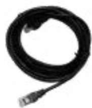
Câble de données