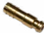
Connecteur du capteur