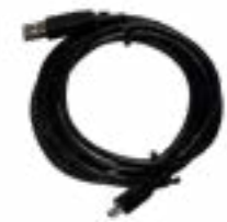
Câble de chargement