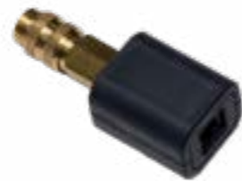
Sensore di pressione