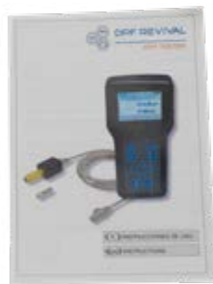
Manuale di istruzioni

Il funzionamento del DPF TESTER è molto semplice e intuitivo.